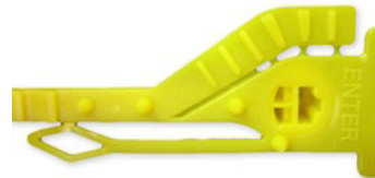
GRIP SEGUR 'POST'