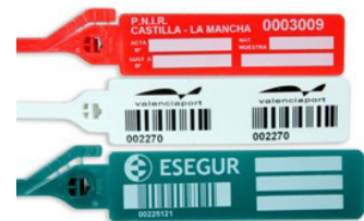
GRIP SEGUR 'POST'